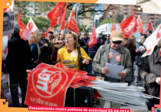
Concentración contra políticas de austeridad 03-04-2014