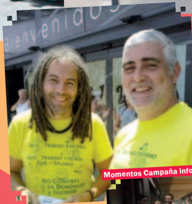
Momentos Campaña informativa trabajadores de Comercio 05-06-2014