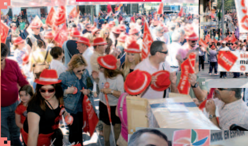
Momentos Manifestación 1 Mayo 2014