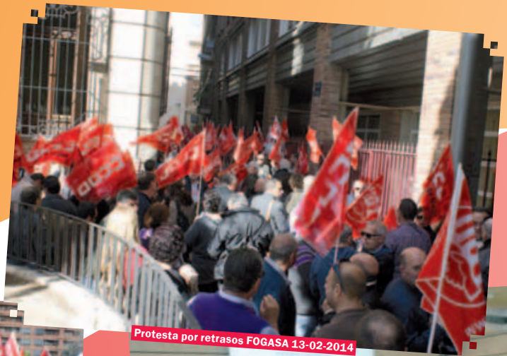
Protesta por retrasos FOGASA 13-02-2014