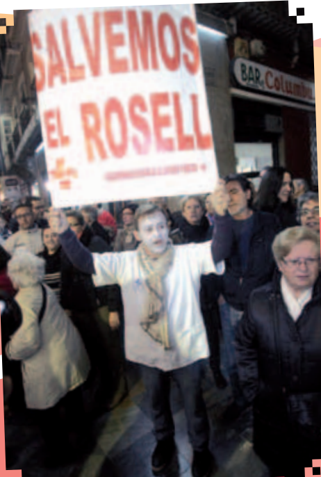
Manifestación Salvemos El Rosell 21-02-2014