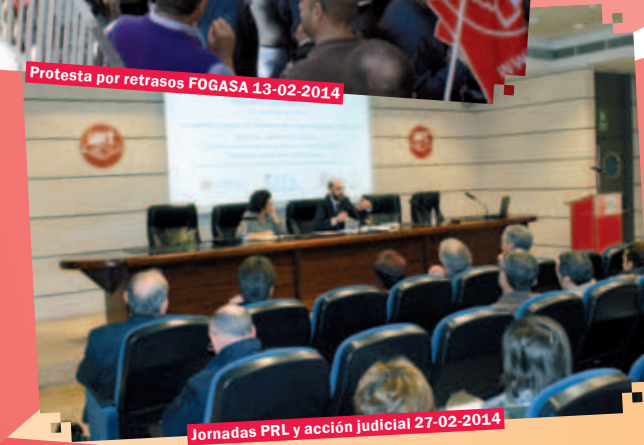
Jornadas PRL y acción judicial 27-02-2014