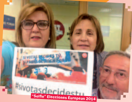
"Selfie" Elecciones Europeas 2014