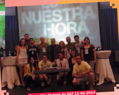
Encuentro Jóvenes de UGT 15-06-2014