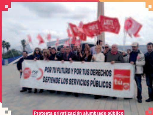
Protesta privatización alumbrado público Torres Cotillas 28-03-2014