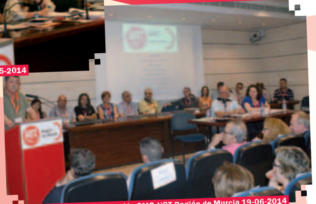
Se crea la nueva Federación SMC-UGT Región de Murcia 19-06-2014