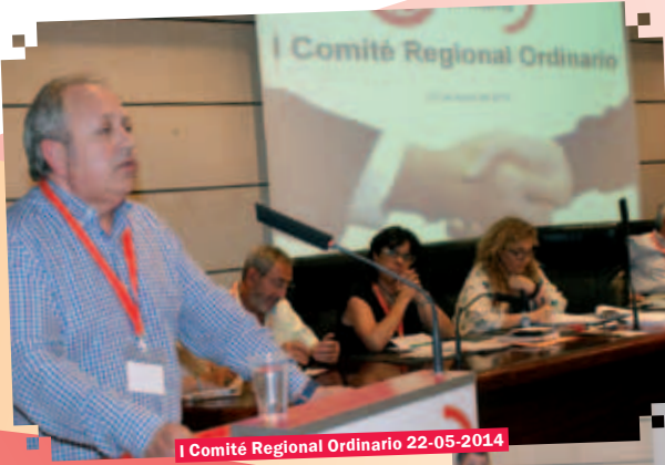
Comité Regional Ordinario 22-05-2014