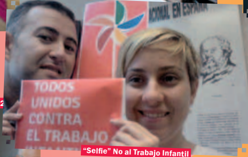
"Selfie" No al Trabajo Infantil