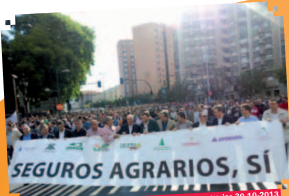
Agricultores por el mantenimiento de los seguros agrarios 30-10-2013