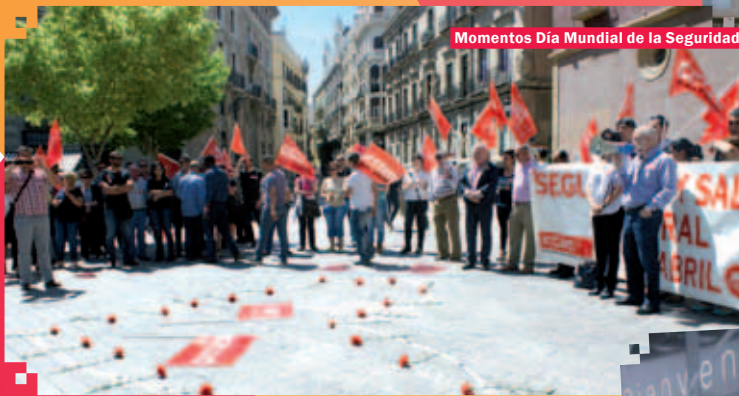
Momentos Día Mundial de la Seguridad y Salud en el Trabajo 28-04-2014